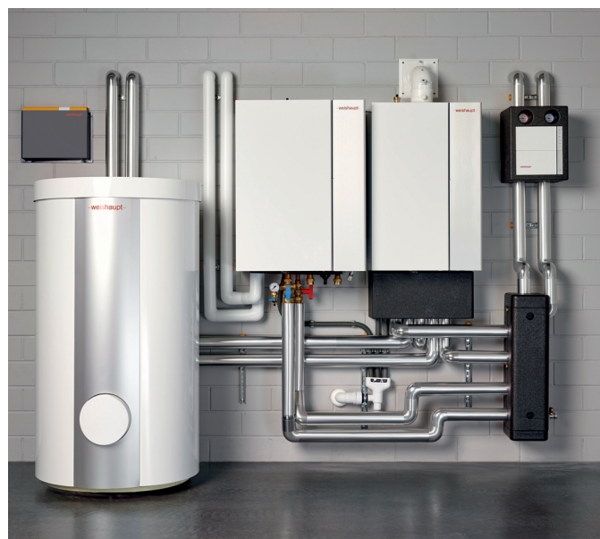
I sistemi ibridi (per esempio, una caldaia a condensazione a gas combinata con una pompa di calore split) rientrano tra gli incentivi previsti dagli Ecobonus e sconto in fattura. Potete trovare maggiori informazioni su questo sito: https://www.weishaupt.it/servizi/incentivi-e-sgravi-fiscali

Mentre l'utilizzo della sola pompa di calore in una nuova costruzione o in un edificio esistente con riscaldamento a pavimento è la soluzione ideale. La combinazione di una caldaia a condensazione a gas Weishaupt con una pompa di calore Weishaupt, permette di utilizzare per gran parte della stagione la sola pompa di calore, in modo efficiente ed economico, anche con i radiatori. Nei giorni più freddi con temperature esterne rigide, in automatico la caldaia assicura ai radiatori la giusta temperatura per scaldare l'abitazione e per produrre l'acqua calda sanitaria.